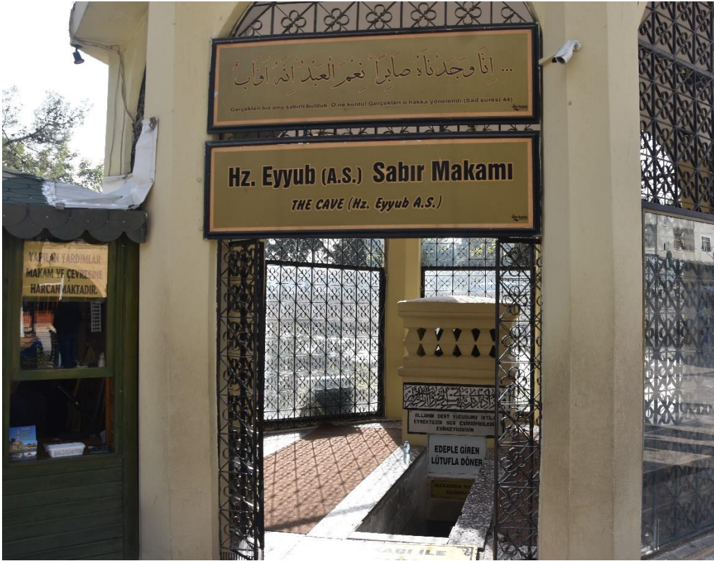
Makam Nabi Ayyub di Sanli Urfa, Turki

Berkeanaan dengan air yang terpancar selepas Nabi Ayub menghentakkan kakinya, sehingga hari ini orang masih lagi mengambil air itu untuk dijadikan penawar penyakit.