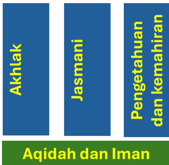
Rajah 4.1 Juzuk asas pembangunan bakat