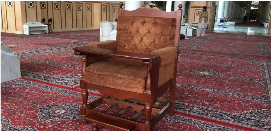
Kursi guru di Masjid Nabawi

Dalam gagasan Masjid Nabawi, kecerdasan menjadi elemen yang amat penting dalam menentukan latihan-latihan yang diberikan. Kuncinya ialah, setiap orang cerdas, pandai dan cerdik dalam bidang masing-masing. Bukankah Zaid bin Tsabit mempunyai kecerdasan bahasa yang tinggi dan Rasulullah ﷺ memerintahkannya belajar Bahasa Suryani (Aramaic) dan Ibrani (Hebrew)? Demikian juga Muaz bin Jabal yang kecerdasan logik dan matematikanya amat tinggi sehingga ia dihantar oleh Rasulullah ﷺ ke Yaman sebagai wakilnya untuk mengajar, menyelesaikan masalah dan memungut zakat ketika usianya sangat muda. Usamah bin Zaid mempunyai kecerdasan jasmani-kenestatik dan logik serta interpersonal yang tinggi sehingga ketika berusia 18 tahun telah dilantik oleh Rasulullah ﷺ menjadi panglima perang untuk melawan tentera Rom-Bysantine.