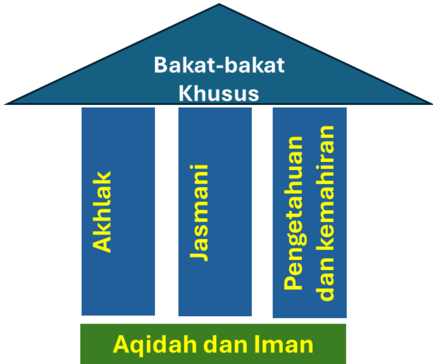
Rajah 5.2 Pembangunan Bakat Khusus

Sebaik-baiknya kalian pada masa jahiliyah adalah yang terbaik di antara kalian pada masa Islam, jika mereka faham agama. (Bukhari)